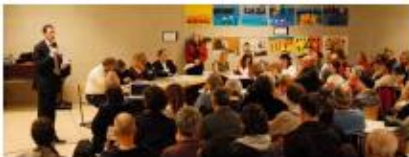
Soirée-Forum 17 mars 2008