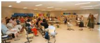
Ateliers-Forum 21 juin 2008

Synthèse du travail réalisé par les habitants du quartier printemps 2008