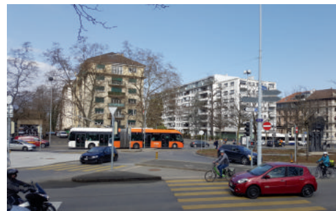
Place des Charmilles

Nous sommes également intervenus sur d'autres dossiers mobilité : la transformation de l'axe Charmilles-Nations (une étude mandatée par la Ville de Genève), le problème du bruit routier dans le secteur 1203, et celui des nuisances existant au carrefour des Délices.