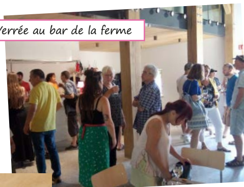
Verrée au bar de la ferme