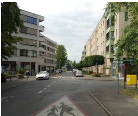
Le carrefour entre av. Henri-Golay et rue Jean-Simonet