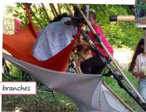
Hamac dans les branches