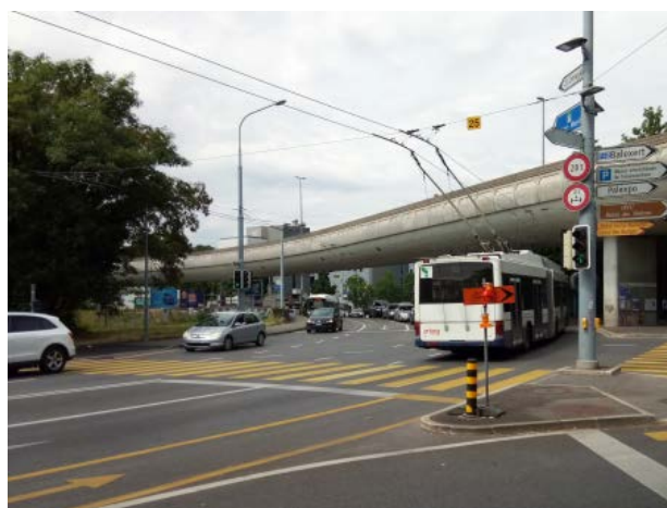
L'avenue de Châtelaine au carrefour de l'Écu

Un bus à haut niveau de service (BHNS) couvrira la zone Genève-Vernier-Zimeysa en passant par le carrefour de l'Écu et l'avenue de Châtelaine, qui va aussi être réaménagée avec plus de place pour la mobilité douce. Il s'agira de bus électriques plus autonomes, plus fréquents (un bus toutes les 3 minutes pour rejoindre le centre-ville) et avec plus de places assises.