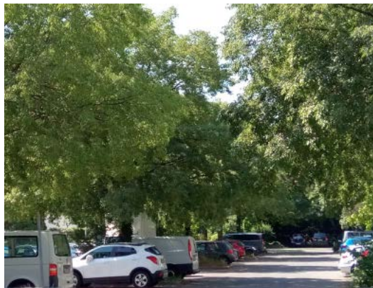
Le parking du chemin des Sports

Le PDQ Concorde donne une intention forte en matière de création d'espaces publics. Cependant, la plupart des parcelles sont aujourd'hui aux mains de propriétaires privés et destinées au logement. Les espaces publics restants sont des espaces de rue et des éléments du réseau routier. Dans la recherche d'un équilibre, une piste de solution est la reconversion de certains parkings à ciel ouvert en espaces collectifs de rencontres ou de loisirs. L'offre de parkings pensée par le PDQ Concorde suppose des parkings mutualisés en périphérie du quartier afin de réfréner la circulation routière à l'intérieur du quartier.