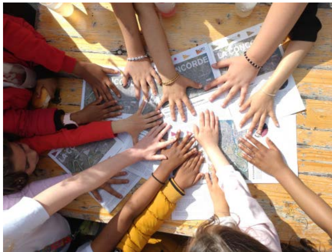
Les enfants qui ont participé à cette interview à la MQ Concorde