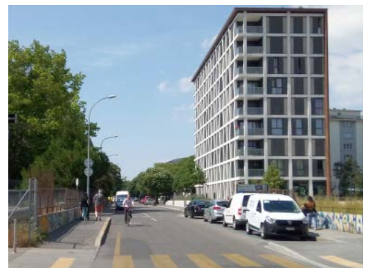
La voie verte croise le chemin des Sports

La réduction de la circulation de transit aura pour corollaire une réduction globale de la circulation routière et donc de l'accessibilité en voiture au quartier. Ce parti pris réduit le confort des automobilistes, y compris de celles et ceux qui habitent le quartier. Le PDQ Concorde a été travaillé il y a plus de 10 ans avec les habitant-e-s dans le cadre d'un processus de participation. Ce processus a donné lieu alors à des principes et de projets de mobilité audacieux : une réduction de la circulation et du transit à l'intérieur du quartier, des rues arborisées en zone 20 ou 30, des espaces publics centraux et attrayants, la part belle à la petite reine avec une voie verte, ainsi que des liaisons de mobilité douce entre les différents quartiers.