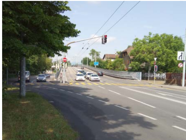
Avenue d'Aire, accès du Pont Butin et viaduc vers le Lignon

Le U-turn sur l'avenue d'Aire permettra de rejoindre le Lignon depuis le Pont Butin et mettra un terme à la circulation autour du giratoire habité, c'est-à-dire à l'entrée de voitures en transit à l'intérieur du quartier, actuellement via l'avenue de la Concorde et le chemin Désiré. Cet ouvrage comprendra également une bretelle qui permettra de rejoindre l'avenue de l'Ain pour aller en direction de Châtelaine depuis l'avenue d'Aire.