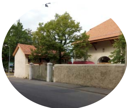
"Certains trottoirs sont étroits, comme devant la ferme Menut-Pellet"