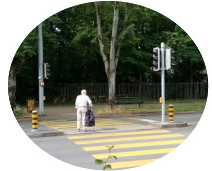
" L'attente peut être longue aux feux rouges des passages piétons "