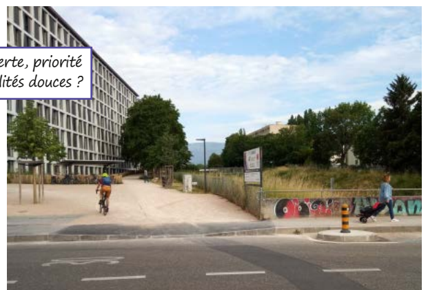
La voie verte, priorité aux mobilités douces ?