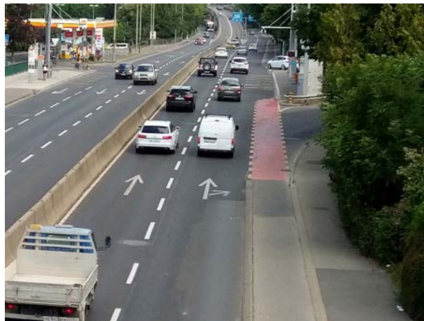
L'avenue de l'Ain, une barrière entre les quartiers Concorde et Libellules

L'entrée par la rue Jean-Simonet garantira l'accessibilité au quartier et au parking mutualisé du secteur L (actuellement en chantier). Le réaménagement paysager de l'avenue de l'Ain tentera de compenser la fracture que cette route constitue entre les quartiers Concorde et Libellules. Trois liaisons de mobilité douce sont prévues: un élargissement du passage sous-voie existant, la création d'un passage piéton (en lieu et place du projet de passerelle) et un accès compatible avec la voie verte en lien avec le nouvel accès par la rue Jean-Simonet.