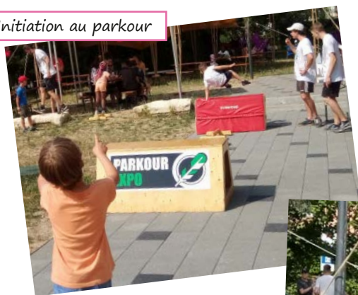
Initiation au parkour