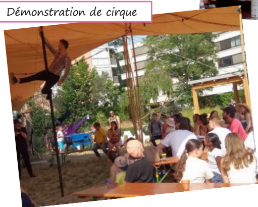
Démonstration de cirque